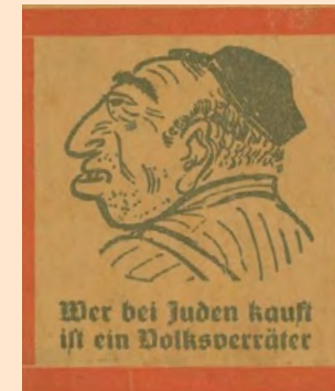
Selo antissemita afixado nos estabelecimentos comerciais da comunidade judaica durante o período nazista na Alemanha, com os seguintes dizeres em alemão: “quem compra de judeus é um traidor do povo”, 1940, Museu Judaico de São Paulo.

No caso do antissemitismo, existem estereótipos parecidos com aqueles atribuídos a outras minorias: inferiores moralmente, mentirosos, traiçoeiros. Mas aos judeus também são atribuídos estereótipos quase opostos, de superioridade, como endinheirados, de algum modo exercendo controle sobre o mundo. Judeus são associados ao dinheiro por meio de termos aparentemente positivos, como “astutos” e “bons de negócio”. Mas essa imagem vem acompanhada pela ideia de que judeus são ricos, privilegiados, poderosos, exploradores da força de trabalho e, por isso, não podem ser considerados oprimidos.