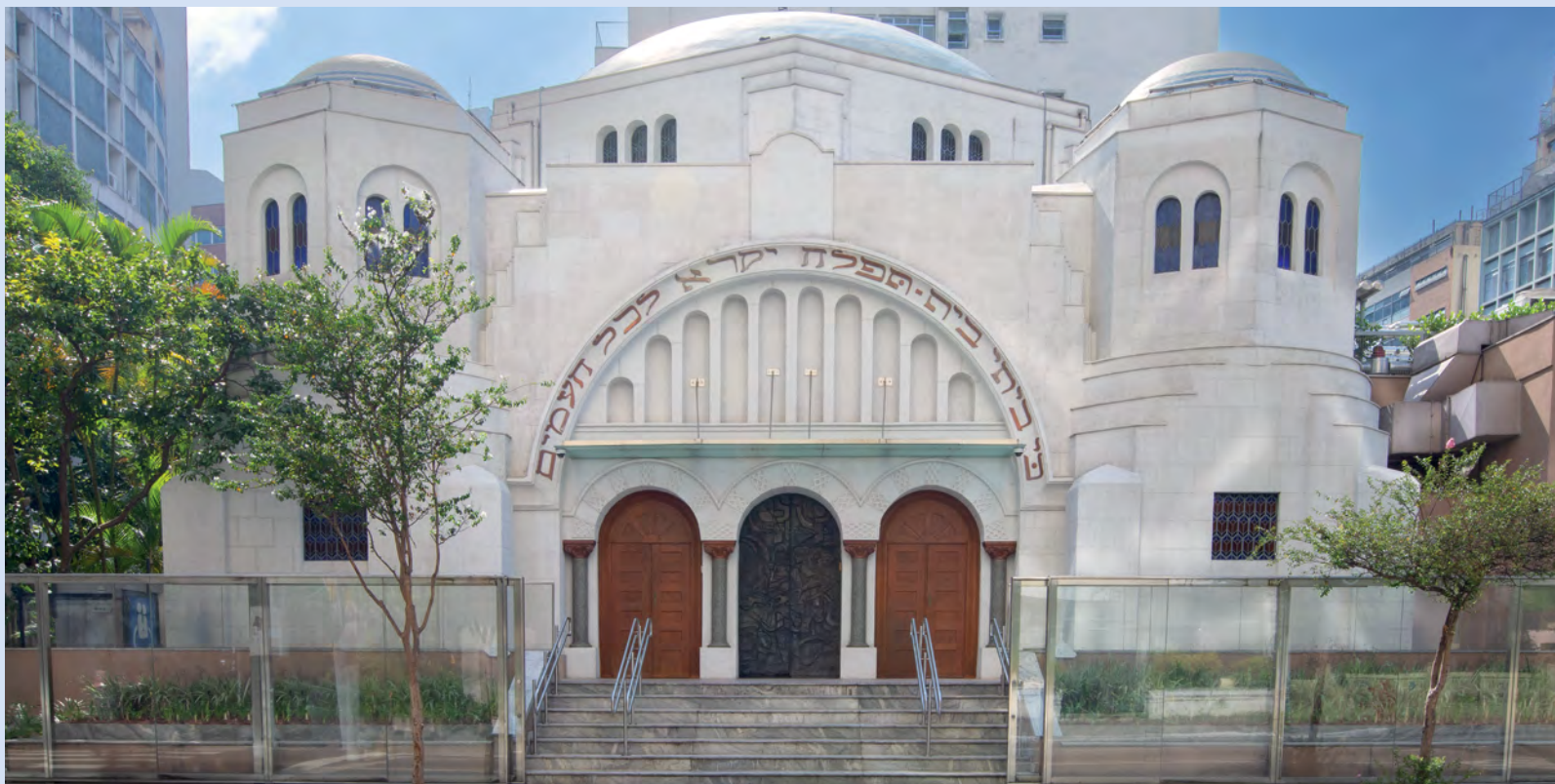
Museu Judaico de São Paulo, 2023.

e histórias judaicas como ferramenta de combate ao antissemitismo.