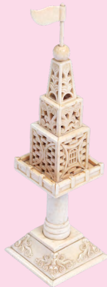
Caixa de Especiarias (Bessamim), originária do continente africano, Marfim, s/d, Museu Judaico de São Paulo.