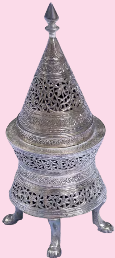
Caixa de Especiarias (Bessamim), Marrocos, Metal, s/d, Museu Judaico de São Paulo.