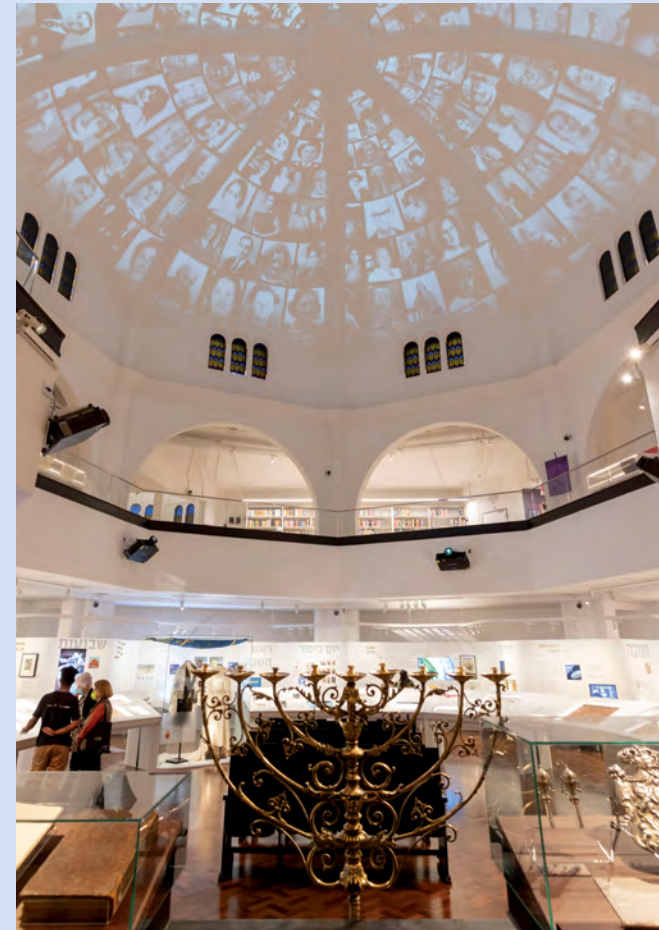
Exposição Vida Judaica , Museu Judaico de São Paulo.

Desejamos uma boa leitura e nos encontramos no MUJ!