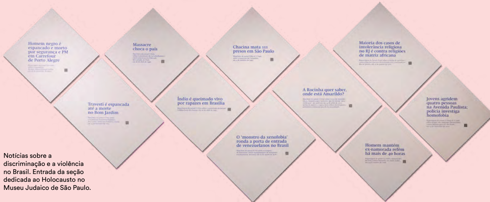
Notícias sobre a discriminação e a violência no Brasil. Entrada da seção dedicada ao Holocausto no Museu Judaico de São Paulo.

Assim, a formação do território que convencionamos chamar de Brasil está marcada por períodos históricos e processos sociais que moldaram a estrutura do país, especialmente no que se refere à inserção de milhões de pessoas dos mais diversos grupos étnicos africanos trazidos ao país. Desde a chegada dos primeiros africanos no século XVI, passando pelos ciclos econômicos e pela administração colonial, a presença negra foi fundamental para o desenvolvimento econômico e cultural do país, embora permeada na maioria das vezes por contextos de opressão e exclusão.