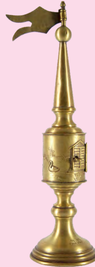
Caixa de Especiarias ( Bessamim ), Varsóvia, Metal, 1920, Museu Judaico de São Paulo.

Por ser um povo diaspórico há milênios, os judeus incorporaram tradições das regiões que habitaram, o que deu origem a uma divisão em três principais grupos culturais, cada um bastante diverso internamente também. Esses três grupos são: ashkenazita, sefaradita e mizrahi.